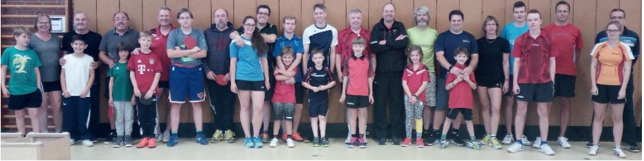
Gruppenbild aller 14 teilnehmenden Paarungen beim Familienturnier