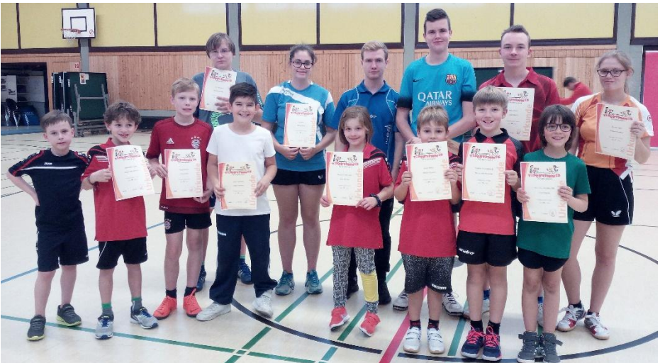
Siegerehrung der Jugendlichen