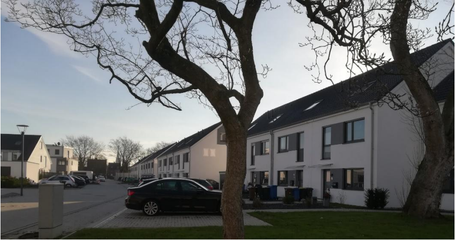
Blick von der Karl-Lange-Straße in die Spulereistraße

In der Verseidag wurden seit 1898 seidene Krawattenstoffe und später Kleider- und Futterstoffe gewebt. Die Firma hatte in der Spitze bis zu 1.000 Mitarbeiter. Eine Gedenktafel an der Prinz-Ferdinand-Straße beschreibt die Firmen-Historie von der Gründung bis zur Schließung 2008.