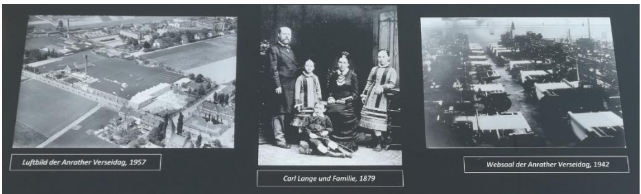
Ausschnitt der Gedenktafel an der Prinz-Ferdinand-Straße

In der Verseidag wurden seit 1898 seidene Krawattenstoffe und später Kleider- und Futterstoffe gewebt. Die Firma hatte in der Spitze bis zu 1.000 Mitarbeiter. Eine Gedenktafel an der Prinz-Ferdinand-Straße beschreibt die Firmen-Historie von der Gründung bis zur Schließung 2008.