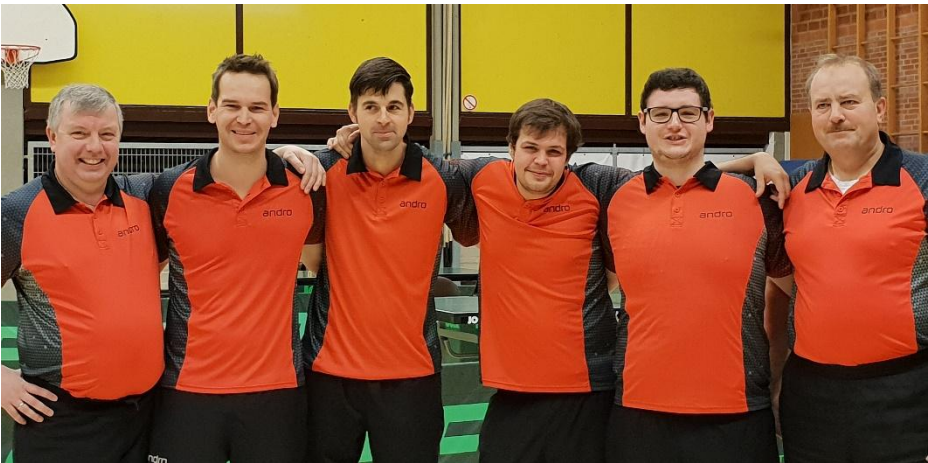
1. Herren zur Rückrunde