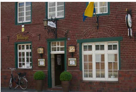
Gaststätte „Enn de Spoul“, Anrath, Viersener Straße