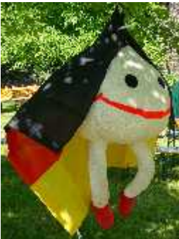
ATK-Möppi Maskottchen des ATK