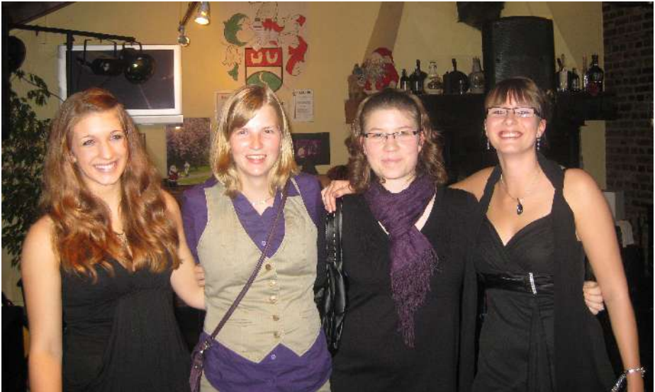
Die 1. Damen macht auch bei schicken Anlässen eine gute Figur!

Wir bedanken uns bei allen für die tolle Unterstützung bei unseren Heimspielen und wünschen allen Mannschaften eine erfolgreiche Rückrunde!